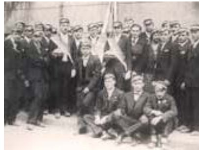
Sodalitacja Mariańska Akademików (SMA)