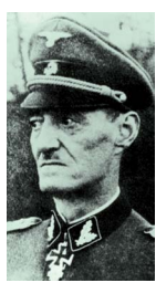
Oskar Dirlewanger niemiecki zbrodniarz wojenny. Oberführer SS, znany z sadyzmu dowódca specjalnej jednostki karnej SS. Odpowiada za śmierć kilkudziesięciu tysięcy mieszkańców Woli. 5 sierpnia 1944 r. znane jako „czarna sobota”. Od redakcji