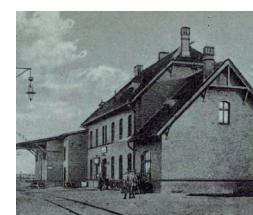
2 października 1906 roku, stacja Osie przyjmuje pierwszy regularny pociąg.

Dzień 2 października 1906 roku był wielkim wydarzeniem dla mieszkańców Śliwic i okolicznych wiosek. Tego dnia została oddana do użytku linia kolejowa Laskowice Pom. - Osie - Śliwice - Szlachta - Czersk o długości 55,3 km. Miało to ogromne znaczenie dla dalszego rozwoju tych okolic.