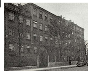
Durchgangslager, potocznie Dulag. Obóz przejściowy przy ul. Skaryszewskiej 8 dla osób aresztowanych w łapankach. Otwarty w 1941 roku w budynku szkoły.

W prywatnej szkole Paszke - Folakowej na ul. Wrzesińskiej to patriotyczne wychowanie ujawniało się na lekcjach polskiego, które były substytutem lekcji historii. Szkoła potajemnie zaopatrzyła nas w „Małego Piłsudczyka” i opracione roczniki